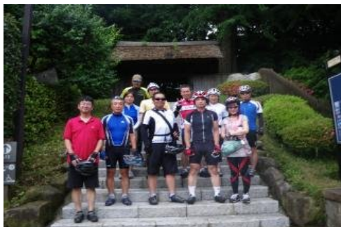
おはよ～戸定が丘歴史公園

* おはよ～サイクリングのスケジュール・コースについてはホームページでご確認をお願いします。