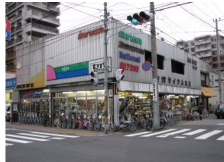
セオサイクル船橋店 ( http://www.seocycle.com/ )